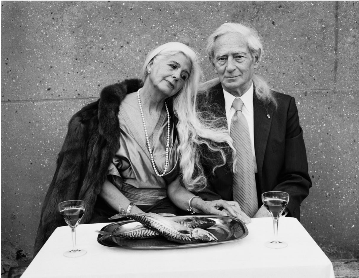
Portrait of my mother and father, 1987. Blok woonde als diplomatendochter in verschillende Latijns-Amerikaanse landen.

Het vroegste werk in de chronologisch opgezette tentoonstelling bevat veel zelfportretten. En in foto's van vriendinnen Flor en Karin figureren opvallend vaak spiegels – zelfonderzoek via de ander. Maar Blok liet de valkuilen van het jeugdig navelstaren al snel achter zich en de vraag 'wie ben ik?' werd vervangen door: wat betekent het om mens te zijn, een sociaal dier dat wordt bepaald door zijn relaties met soortgenoten?