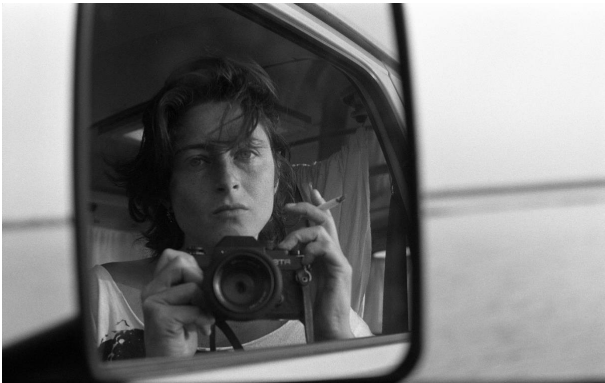
Zelfportret in Arles, 1982. Beeld Diana Blok

Je kunt je afvragen wat Bloks foto's nou beter, aangrijpender, tijdlozer maakt dan de vele andere reportages over jonge homo's die hun seksuele identiteit ontdekken of transgender sekswerkers. Het is haar grip op de fotografie. Met krachtige kadrering kan zij een compleet verhaal vertellen door juist dingen weg te laten. Zoals in L. shows her recent transformation, waarin het getoonde torso vlak boven de schaamstreek eindigt en de borsten zijn bedekt door de omhoog geslagen rok.