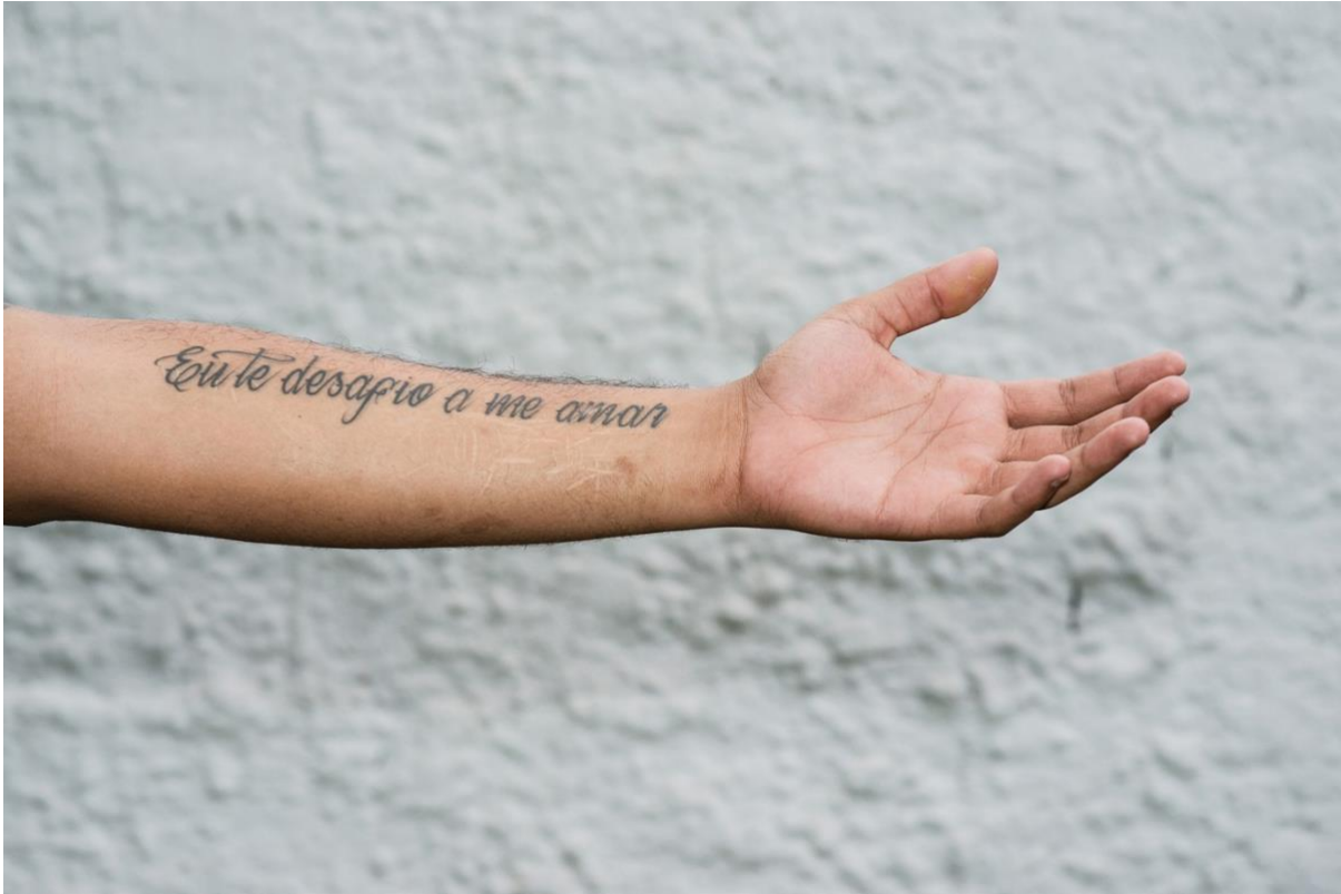
'Ik daag je uit van me te houden.' Getatoeëerde arm van een Braziliaanse trans man.

Onderdeel van die serie is een moeder en zoon met dwerggroei. Hij poseert met een plastic globe als een miniatuur Atlas. Het is het vroegste teken van Bloks voorliefde voor afwijkende lichamen, en het leven dat ermee geleefd wordt.